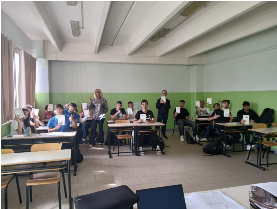
Entry Test and Introduction to the course