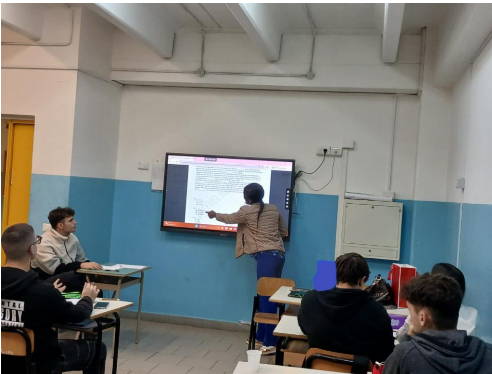
Exercises in group