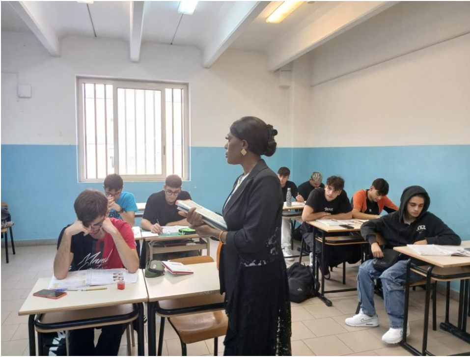
Writing session, Reading and revision of the written component.